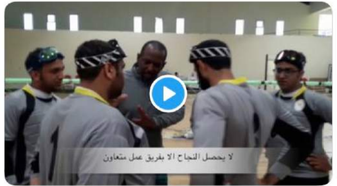
لا يحصل النجاح الا بفريق عمل متعاون