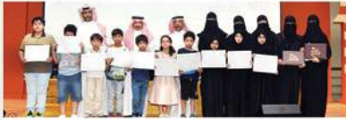
الأطفال المشاركون في البرنامج القرائي الإثرائي (الوطن)

ويستهدف البرنامج الأطفال العاديين، وكذلك من لديهم صعوبات تعلم للفئة العمرية من سن 8 إلى 12 سنة بنين وبنات، ويتضمن البرنامج عدة فعاليات تهم الطفل في هذه المرحلة العمرية، منها قراءة كتاب مناسب وتمثيله أمام الجميع والصعود للمسرح للتدريب على الإلقاء والتمثيل والتقديم والرسم وغيرها، مع استمرار التواصل من قبل المدربات مع الأهل ومتابعة حالة الطفل وتطورها طيلة أيام البرنامج.